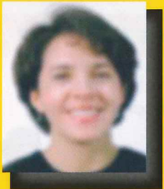
A los 3 meses