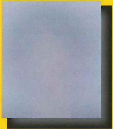
A los 3 días

Como Un Infante Mira El Mundo De una distancia de un metro