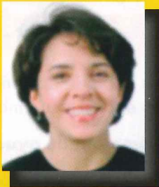
A los 6 meses